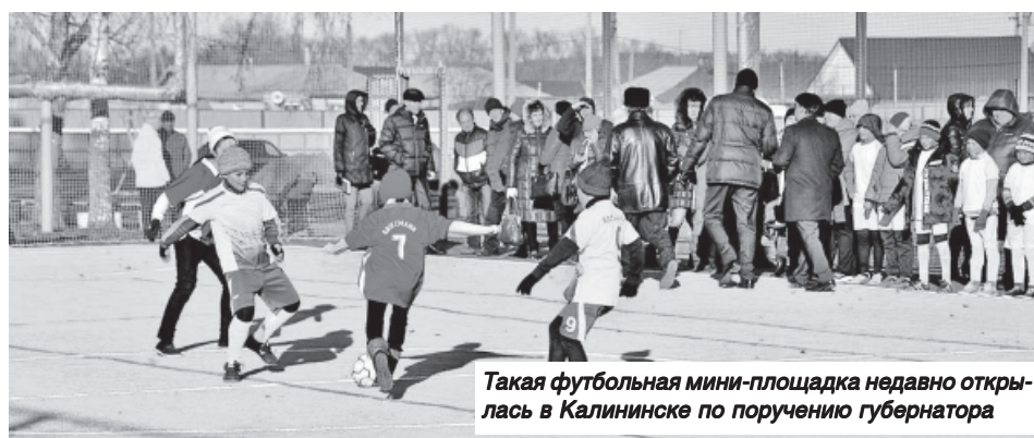
Такая футбольная мини-площадка недавно открылась в Калининске по поручению губернатора

Так, в этом году в селе Александров Гай построена спортивная площадка и закуплено спортивное оборудование для устройства спортплощадки в селе Старая Порубежка Пугачевского района, профинансировано устройство сквера в селе Питерка. Возведен ФАП в селе Привольном Ровенского района, его ввод в