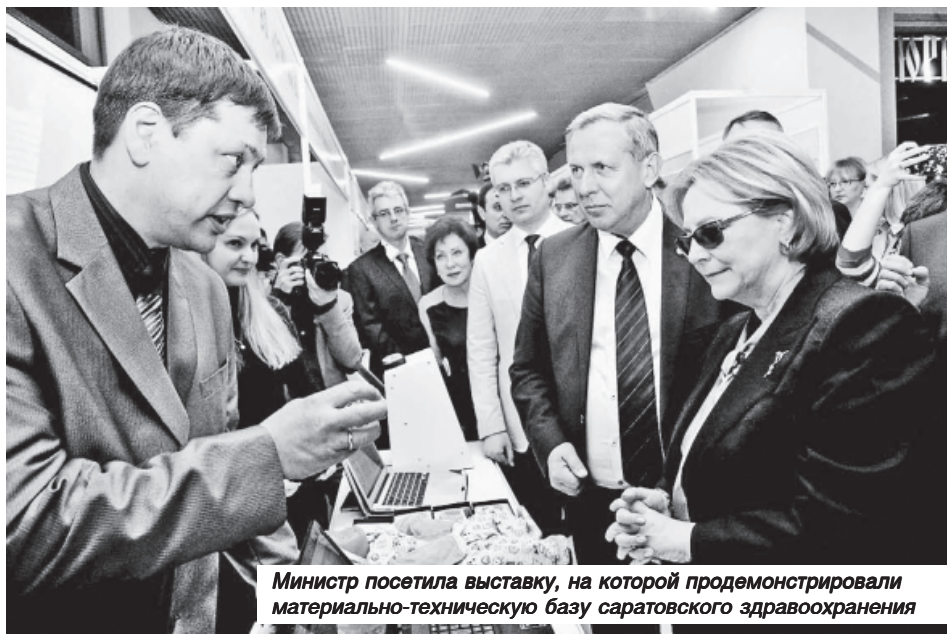
Министр посетила выставку, на которой продемонстрировали материально-техническую базу саратовского здравоохранения

Отдельно обсуждалась тема строительства нового онкодиспансера в Саратовской области. В беседе с Вероникой Скворцовой губернатор Валерий Радаев подчеркнул, что в настоящее время ведется активная работа с Минздравом РФ, а со