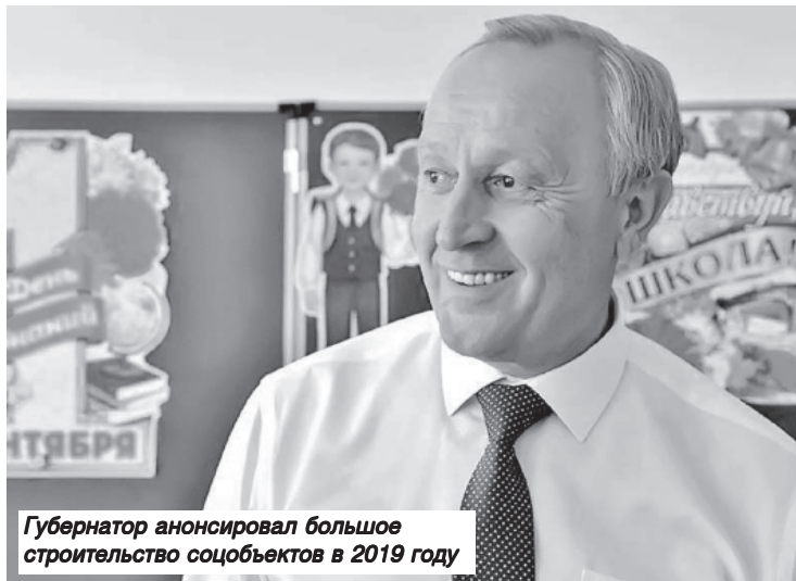
Губернатор анонсировал большое строительство соцобъектов в 2019 году

Что касается очередности в детские сады, то ее планируют закрыть в течение двух лет. Руководство региона поставило задачу на будущий год сдать рекордное число объектов соцсферы для юных жителей - 25 детских и три школы.