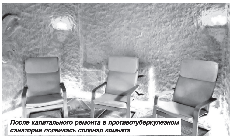
После капитального ремонта в противотуберкулезном санатории появилась соляная комната

- Это здание не ремонтировалось капитально 30 лет. По инициативе губернатора Валерия Васильевича Радаева и при поддержке социального ответственного бизнеса проведен серьезный ремонт и обновлена мебель, приобретены современные развивающие игрушки, открылась обновленная игровая