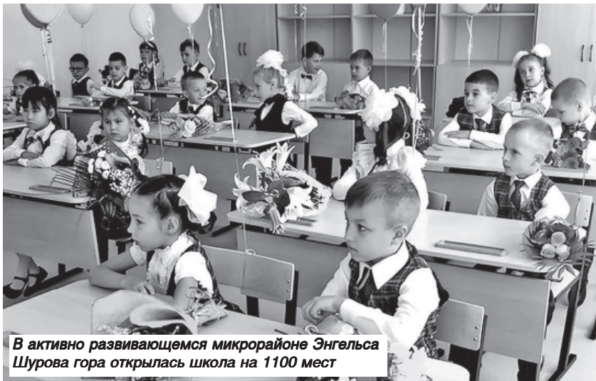
В активно развивающемся микрорайоне Энгельса Шурова гора открылась школа на 1100 мест