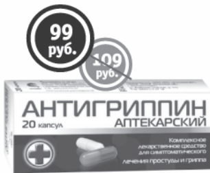
Антигриппин аптекарский, 20 капсул