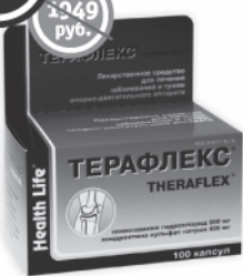
Терафлекс, 100 капсул