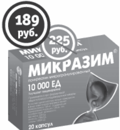
Микразим, 10000 ЕД 20 капсул