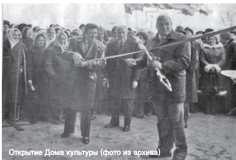
Открытие Дома культуры

готовлено руками самих культработников. К подготовке всех мероприятий работники культуры подходят творчески, с энтузиазмом, креативно, а потому, каждый из праздни-